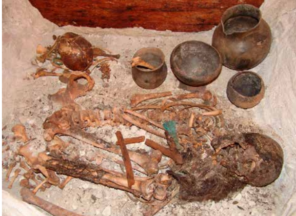
Restos de la sepultura 121

Se trataba de una sepultura en covacha, el tipo normalmente utilizado en el yacimiento. El cierre se hizo con tablones escuadrados de pino salgareño sobre los que se extendió una capa de barro y se antepuso un muro de mampostería. Este cierre hermético ha aislado durante siglos el enterramiento, no permitiendo la filtración de tierra ni agua, lo que, unido a la gran sequedad ambiental ha favorecido la momificación por deshidratación.