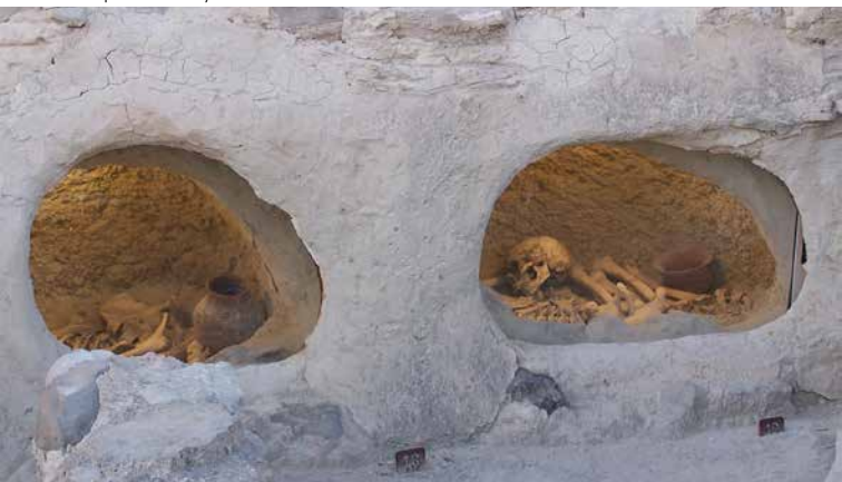
Sepulturas 18 y 19 de la ladera

La Paleoantropología, ciencia que estudia los restos óseos humanos, aporta mucha información en Castellón Alto. La esperanza media de vida al nacer fue de 23 años; ya que había un alto índice de mortandad infantil. Los varones sufrieron traumatismos en hombros y columna por realizar actividades duras como el transporte de pesos. Las mujeres se vieron más afectadas en los codos y la región lumbar por las labores de molienda del cereal. Los restos encontrados también nos ofrecen datos acerca de las diferencias alimenticias entre individuos del mismo asentamiento.