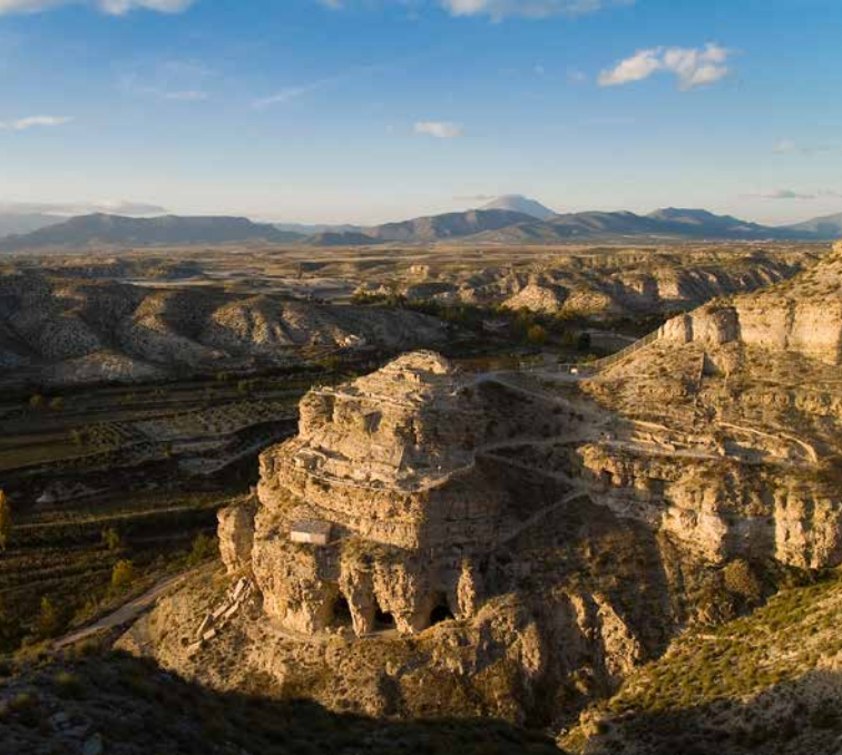
Vista general del yacimiento

El Enclave Arqueológico de Castellón Alto se enmarca dentro de la Cultura Argárica, en un momento avanzado del Bronce Pleno. Su cronología se sitúa entre el 1900 y el 1600 cal a.n.e. Se trata de un poblado agrícola de mediano tamaño.