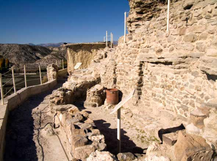
Ámbitos domésticos en la Terraza Intermedia