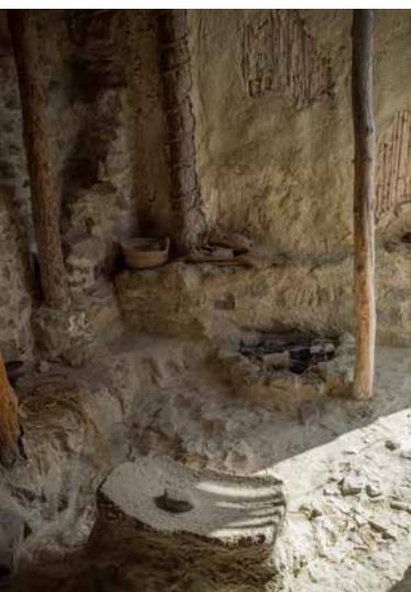
Interior de una vivienda reconstruida

El entorno que nos rodea ha variado mucho en los últimos 40 siglos, ya que el clima actual es más seco. Los estudios realizados en Castellón Alto nos hablan de un paisaje de bosque mediterráneo en el que se observan los primeros síntomas de degradación por la influencia humana.